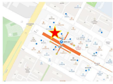
대화역 4번 출구