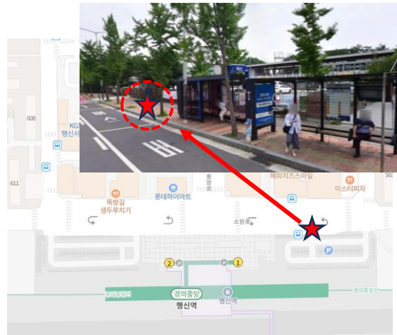
행신역 1번출구 방향 버스승강장