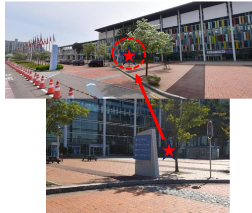
1전시장 4홀 입구앞 버스하차장 (국기계양대 앞)