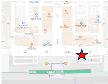
행신역 1번 출구