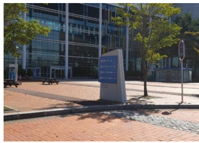
1전시장 4층 입구앞